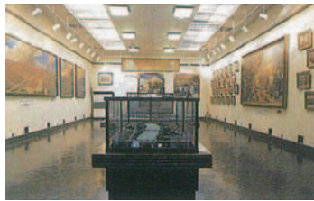
復興記念館展示場

関東大震災の惨事を長く後世に伝え、また焦土を復興させた当時の大事業を記念するため、昭和6年に建設されました。館内には震災及び戦災の記念遺品、当時の状況を伝える絵画、写真、図表などが展示されています。